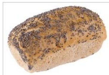
Suggestion de présentation

Ingrédients : eau, amidon de maïs, farine de riz complet, fécule de pomme de terre, graines 8% (graines de lin brun, graines de lin jaune, graines de millet, graines de tournesol), farine de sarrasin, levure, farine de riz, finition 2% (graines de pavot), épaississants (gomme tara, gomme xanthane), sucre, sel.